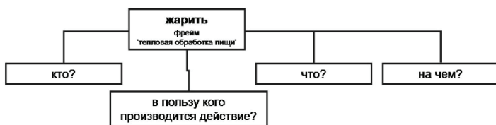
Рис. 1. Элементы конструкции Мама жарила картошку .

Среди ночи она жарила ему яичницу на электроплитке.